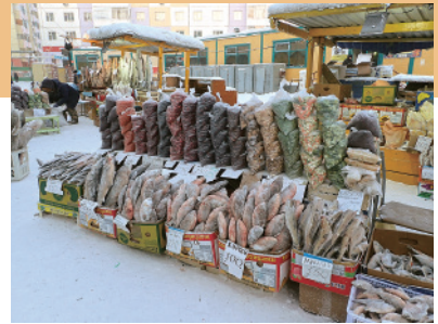
ヤクーツクの露天市場

短期間のシベリア滞在中、気候環境が全く異なる地域での生業をアフリカと比較していると、相違点よりもどちらかという点と類似点のほうが目についた。極端な環境に適応していく人々の知恵は、地域の自然環境に巧みに合わせていく際に似たような仕組みが生み出されてきたことを感じた。しかし、これから調査を深めていくと、想像もしていなかったような独自の仕組みが見えてくることであろう。グローバルに進行する近年の環境変動への対応を考えていく際、遠く離れた2地域の比較は、何か新しいヒントをもたらしてくれるかもしれない。そんな期待や可能性をたくさん感じさせてくれたロシア出張であった。