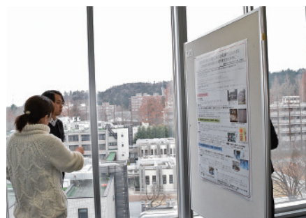
ポスター形式による個人発表の風景