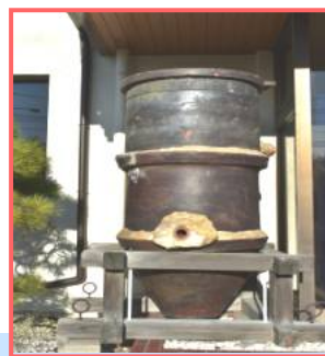
大崎市上下水道部庁舎に 展示されている井側