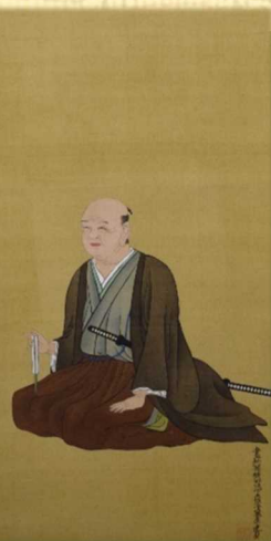
五代 内藤盛昌肖像

江戸時代 須賀川町代官を務めた内藤家文書から”自治都市 須賀川” の形成について、ひも解きます。