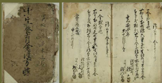
出生養育金渡方牒